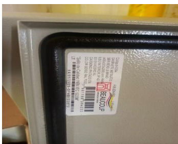
Fotografía 6. Gabinete de control eléctrico