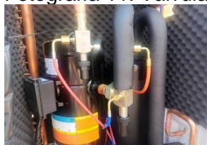
Fotografía 12. válvulas de expansión