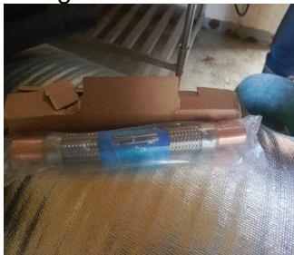
Fotografía 3. Amortizador de vibraciones