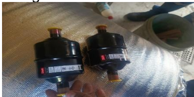
Fotografía 5. Filtro deshidratador