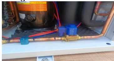
Fotografía 11. Válvula solenoide