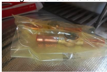
Fotografía 7. Visores de Líquidos