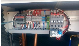
Fotografía 15. Contactores