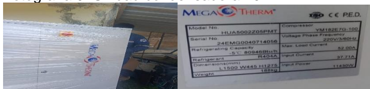
Fotografía 10. Unidad condensadora 8 HP