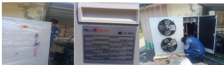
Fotografía 9. Unidad condensadora 10 HP