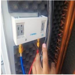
Fotografía 13. Presostatos alta y baja