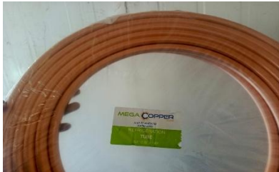
Fotografía 2. TUBERIA DE COBRE 5/8