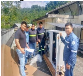
Verificación de los equipos y repuestos utilizados para rehabilitación de los cuartos fríos del camal municipal de Méndez