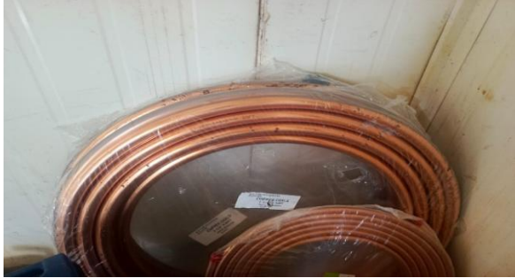
Fotografía 1. TUBERIA DE COBRE 1 1/8

Anexo 1. VERIFICACIÓN FÍSICA DE MATERIALES, CON FECHA 17 DE ENERO DEL 2025