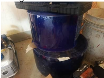
Fotografía 4. Rollo de cortina Pvc